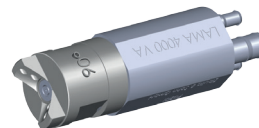
LAMA-4000 mit Breitstrahlaufsatz für Bandbeölung